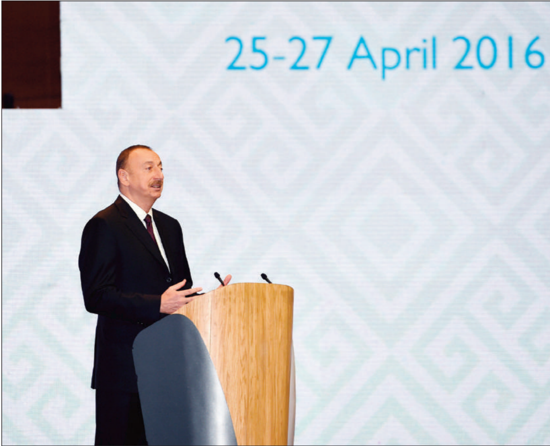
(əvvəli 1-ci səhifədə)

Azərbaycanda həyata keçirilən iqtisadi islahatlar siyasi islahatlarla paralel şəkildə aparılmışdır.