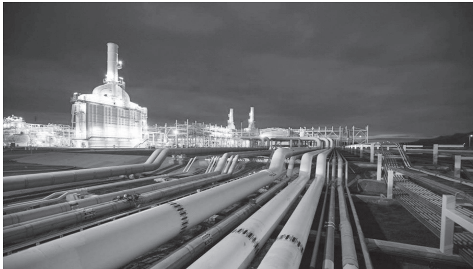
945 тыс. 925 тонн сырой нефти и нефтепродуктов общей стоимостью 11 млрд 588 млн 26 тыс. долларов.

Напомним, что за аналогичный период прошлого года Азербайджан экспортировал 21 млн