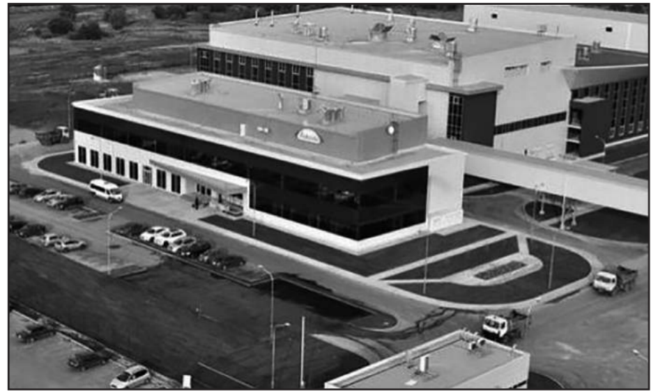
Regionlarda sənaye məhəllələri yaratmaq potensialı mövcuddur

Bütün dünyada olduğu kimi, son vaxtlar Azərbaycanda da sənayeləşmə prosesi böyük vüsət almışdır. Bu proses investisiya qoyuluşlarını və iqtisadi inkişafı stimullaşdırmaqla bərabər, əhalinin yeni iş yerləri ilə təmin edilməsinə də şərait yaradır. Sənayenin inkişafı bütövlükdə iqtisadiyyatın inkişafı üçün mühüm əhəmiyyət kəsb edir. Hazırda qeyri-neft sektorunun strukturunda sənaye xüsusi çəkiyə malikdir. Azərbaycanın bir çox bölgələrində sənaye məhəllələri yaratmaq potensialı mövcuddur. Bir çox şəhərlərdə artıq sənaye müəssisələri var. Məhəllələr yaradılarkən sənaye istehsalı, infrastruktur və bazar imkanları təhlil olunur, müvafiq qərarlar verilir. Bu məhəllələrin yaradılması həm də rayonların öz-lərini iqtisadiyyatlarının inkişafına müsbət təsir göstərir. Sənaye park və məhəllələrinin yaradılması infrastruktur və güzəşt-dəstək sxemləri dünyəvi praktikasına tam uyğundur. Bundan əlavə, ölkə prezidentinin təşəbbüsü ilə qəbul edilmiş qanun və qərarlar sənaye zonalarına investitorların gəlməsi üçün əlavə stimullar yaradır. Hazırda ölkəmizdə sənaye zonalarının yaradılması, sahibkarlıq mühitinin inkişaf etdirilməsi, kiçik və orta sahibkarlıq subyektləri üçün əlverişli investisiya mühitinin yaradılması, qeyri-neft sektorunun