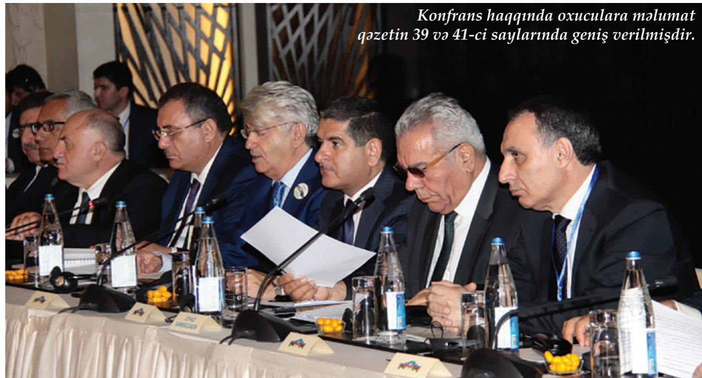
Konfrans haqqında oxuculara məlumat qəzetin 39 və 41-ci saylarında geniş verilmişdir.

2017-ci ilin 21-23 sentyabr tarixlərində Bakı şəhərində Azərbaycan İqtisadçılar İttifaqı və Azərbaycan Respublikası Auditorlar Palatasının birgə təşkilatçılığı ilə "Azərbaycan iqtisadiyyatının strateji yol xəritəsi: hesabatlılıq və şəffaflıq problemləri" mövzusunda beynəlxalq elmi-praktik konfrans keçirilmişdir.