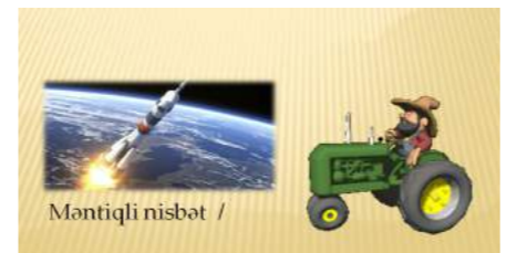
Mantiqli nisbət /