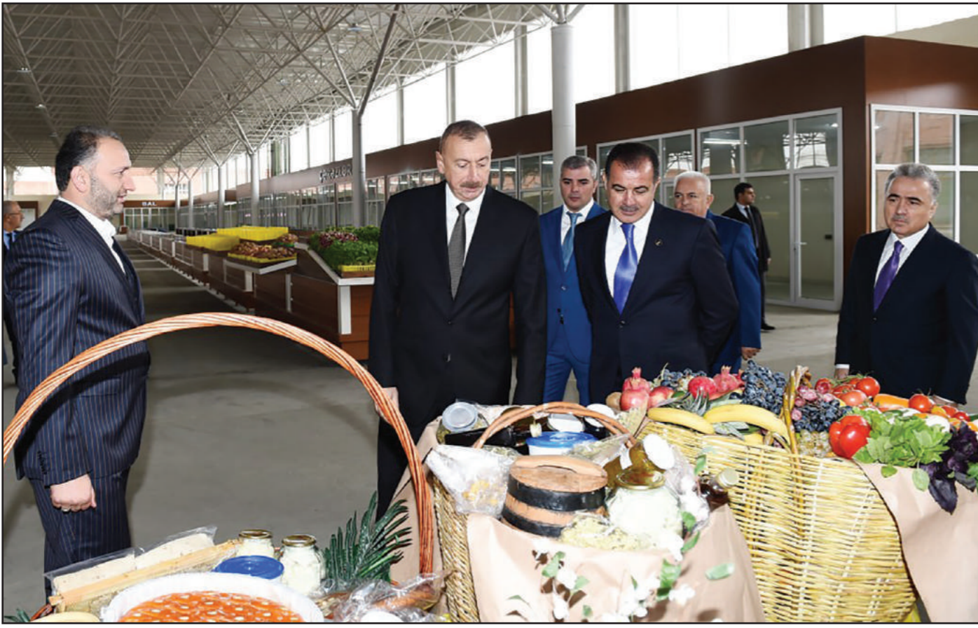
(Əvvəlki 1-ci səhifədə)

Əvvəlki illərdə də Gəncədə sosial layihələrlə, sənaye layihələri ilə bağlı bir çox gözəl işlər görüldü. Bu gün mən bir neçə obyektin açılışında və təqdimatında iştirak edəcəyəm. Onlardan biri Dövlət Aqrar Universitetinin yataqxana binasıdır. Bu, ikinci bina olacaq. Birinci binanı da mən açmışam, o, 520 yerlik binadır. Bu binada da 500-dən çox tələbə yaşayacaq. Şəhərdəki 1 saylı məktəb də əsaslı təmir olunub, mən oraya da baxacağam. Böyük ticarət mərkəzləri - "Gəncə Moll", "Grand Qafqaz" kompleksi açılır. Bu iki böyük ticarət obyektində minlərlə insan işlə təmin olunacaqdır. Gəncədə yeni parklar salınıb. Biz yeni muzeyin açılışını da edəcəyik. İndi Gəncə muzeyləri səhəridir. Gəncə Azərbaycan xalqına o qədər görkəmli şəxsiyyətlər bəxş edib ki, onların hamısının Gəncədə muzeyləri olmalıdır və bu məsələ də öz həllini tapır.