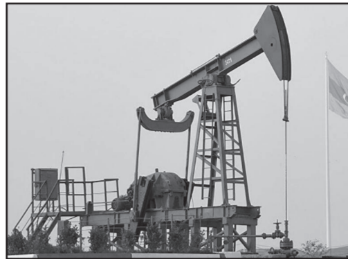
Azərbaycanda neft gəlirlərindən istifadənin yuxarı həddi ilə bağlı fiskal qaydalar artıq hazırdır.