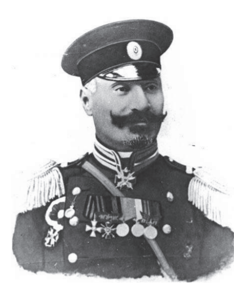
General-leytenant Əliağa Şıxlinski