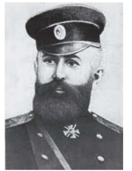
Səməd bəy Mehmandarov

xalqa müraciət etdi. Müraciətdə əvvəllər çağırış işində yol verilən nöqsanlara, hissələrdə əsgərlərə qarşı fiziki güc tətbiq edilməsinə, ağır məişət şəraitinə toxunulmaqla bərabər, bu halların aradan qaldırılması üçün qətiyyətli tədbirlərin həyata keçirilməsinə başlandı da bəyan edilirdi.