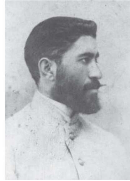
Hərbi nazir Xosrov Paşa bəy Sultanov (1918-ci il)

Nazirliyin rəhbərliyi hərbi xidmətin təşkilinin hüquqi əsasda nizamlanmasına xüsusi diqqət yetirirdi. Azərbaycan ordusunun qanunvericilik bazasını qısa müddətdə yaratmaq mümkün olmadığı üçün hərbi nazirin 1919-cu ilin əvvəlində imzaladığı əmrilə keçmiş Rusiya imperiyasında 1917-ci il yanvar ayının 1-dək qəbul edilmiş hərbi qanunvericilik aktları, müvəqqəti olaraq, qüvvədə saxlanıldı. Bura hərbi nizamnamələr, döyüş təlimatları, hərbi xidmətin bütün sahələrini tənzimləyən sənədlər, səfərbərlik, hərbi məhkəmə işlərinin aparılması üzrə təlimatlar və s. daxil idi. Lakin bu qanunvericilik aktlarının Azərbaycanın müstəqilliyi, milli orduda xidmətin bu və ya digər tələbləri ilə uyğun gəlməyən cəhətləri ləğv edilir, həmin məqamlar təkmilləşdirilir və ya yenisi ilə əvəz olunurdu. Həmin qanunvericilik aktlarına uyğun olaraq, Rusiya ordusunda tətbiq edilən hərbi rütbələr olduğu kimi, hərbi rütbələrin fərqlənmə nişanları olan poqonlar isə təkmilləşdirilərək