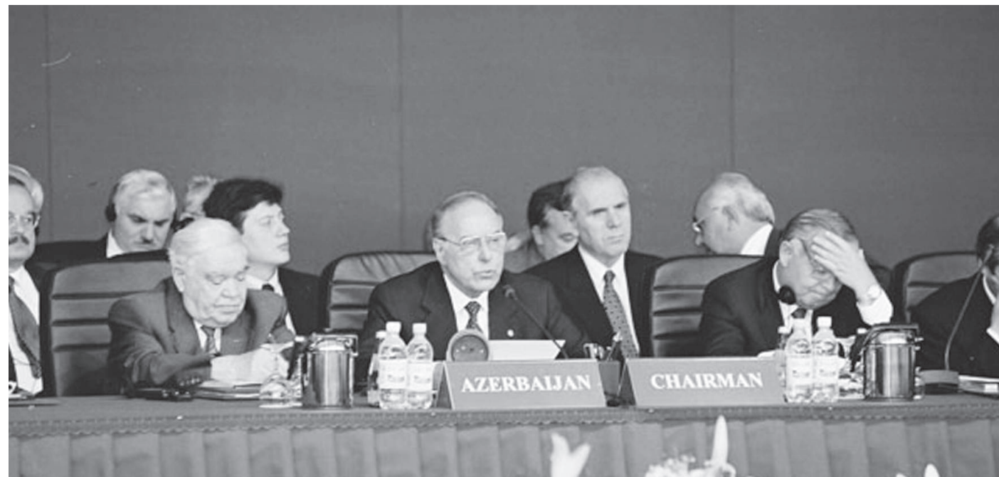
Vətəni, torpağını, millətini, ölkəsini sevən hər bir azərbaycanlı, Azərbaycan vətəndaşının bu hadisə ilə fəxr etməyə əsası vardır və bununla hər bir adam fəxr edə bilər. Çünki bu, bizim millətimizin, ölkəmizin, dövlətimizin adıdır.

ordinasiya, demək olar ki, çox zəif olub. Sərt sovet sistemi olub, itti-faq maraqları üstünlük təşkil edib. Amma bu gün Azərbaycanın apardığı iqtisadi siyasətdə nəqliyyatın kompleks inkişaf məsələsi ortaya çıxır. Nəqliyyatın o kompleks inkişafı məsələsi nədir? Biz Xəzər Dəniz Gəmiçiliyini inkişaf etdiririk. Bakı Beynəlxalq Dəniz Ticarət Limanını yaradıırıq, dəmir yollarını inkişaf etdiririk, eyni zamanda, TRACECA proqramı çərçivəsində yeni, müasir avtomobil yolları salınır. Avtomobil yollarını da inkişaf etdiririk. Yəni, nəqliyyatın sistemli, dinamik, tarazlı inkişafı, bütövlükdə, nəqliyyat konsepsiyasının səmərəsini artırır.