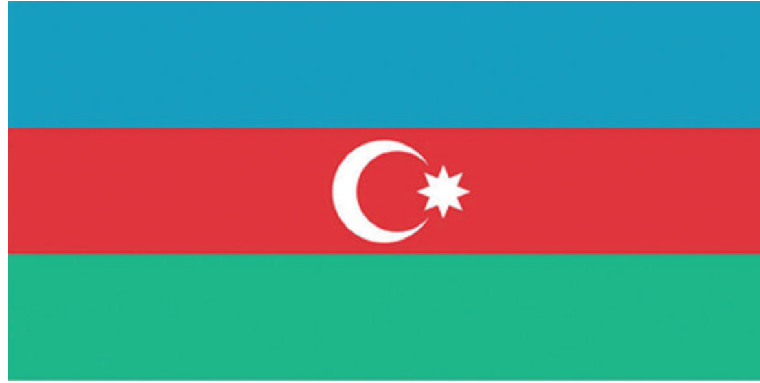
Xalq Cümhuriyyətinin üçrəngli bayrağı, 1918, 9 noyabr

yaşadığı ərazilərdə sayısız-hesabsız qədim abidələr tikilib və bu abidələrin əksəriyyəti göy rəngdə olub. Bu baxımdan göy rəng, həm də simvolik mənə daşıyır. Göy rəng XIII əsrdə Elxanilər dövrünün əzəmətinə, onların zəfər yürüşlərini əks etdirirdi. Qırmızı rəng - müasir cəmiyyət qurmaq, demokratiyanı inkişaf etdirmək, bir sözlə, müasirləşməni, inkişafa istəyi ifadə edir. XVIII əsrin sonlarında Fransa Burjua inqilabından sonra kapitalizmin inkişafı ilə bağlı Avropa ölkələrində böyük irəliləyişlər baş verib. Həmin dövrdə proletariyatın kapitalizm quruluşuna qarşı mübarizəsi olub. Bu illərdə qırmızı rəng Avropanın simvoluna çevrildi. Yaşıl rəng - islam sivilizasiyasına və dininə mənsubluğu ifadə edir. Azərbaycan bayrağının üç rəngi: türk milli mədəniyyətinin, müsəlman sivilizasiyasının və müasir Avropa demokratik əsaslarının simvoludur. Milli operamızın banisi, dövlətimizin digər rəmzinin - dövlət himninin müəllifi dahi Üzeyir Hacıbəylinin fikrincə, bayrağımızın mənəvi mənası olaraq al boya türkçülüyə, yaşıl boya islamlığa, mavi boya isə mədəniyyətə işarədir. Tarixçilərin bildirdiklərinə görə, bayrağın qırmızı rənginin ortasında təsvir olunan aypara və səkkizguşəli ulduzun