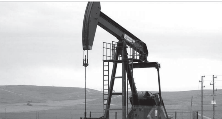
Bu sözləri OPEC və OPEC+ ölkələrinin neft istehsalını sutkada 1,2 milyon barrel azaltmasını şərh edərək mərkəzi ofisi Şot-

se Hittle deyib. O bildirib: "Xam neft istehsalının azaldılması gələcək ilin üçüncü rübündə qlobal neft bazarını möhkəmləndirərək "Brent" markalı neftin bir barrelinin qiymətinin 70 dollara yüksəlməsinə səbəb olacaq. OPEC üzrə ən böyük neft istehsalçısı olan Səudiyyə Ərəbistanı uzunmüddətli perspektivdə qlobal neft bazarını idarə etməyi, qiymətin sətir enməsinə və ya yüksəlməsinə maneə olmağa çalışır. Bununla da Səudiyyə Ərəbistanı qlobal tələbatını və sənayedəki neft tədarükünü qorumaq məqsədi güdür".