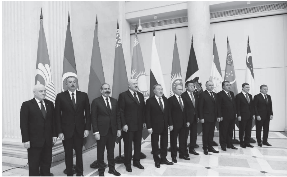
Dekabrın 6-da Azərbaycan Respublikasının Prezidenti İlham Əliyev Rusiya Federasiyasının Prezidenti Vladimir Putinin

Prezident İlham Əliyev MDB dövlət başçılarının qeyri-rəsmi zirvə görüşündə iştirak etmək üçün Prezident Kitabxanasına gedib. Rusiya Federasiyasının Prezidenti Vladimir Putin Azərbaycan Respublikasının Prezidenti İlham Əliyevi qarşılayıb. Sonra MDB dövlət başçılarının qeyri-rəsmi zirvə görüşü keçirilmişdir. Dövlət başçılar Sankt-Peterburq Dövlət Akademik Mariinski Teatrında Pyotr Çaykovskinin "Şelkuncik" baletinə baxmışlar. Bununla da Azərbaycan Prezidenti İlham Əliyevin Rusiyaya işgüzar səfəri başa çatıb.