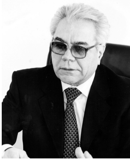
Ziyad Səmədzadə - akademik, millət vəkili

respublikamız üçün geniş inkişaf imkanları yarada bilər. İqtisadiyyat elmi sahəsində də potensialımız güclüdür. Azərbaycan Dövlət İqtisad Universitetinin professor-müəllim heyətinin, istedadlı tələbə-gənclərin yarıdıcılığına xarakterizə edilən faktlarla tanışlıq bunu sübut edir. Mən həyatdan köçmüş iqtisadçı alimlərimizin xatirəsini bir daha əziz tutur, bu gün elm, təhsil ocaqlarında, iqtisadi həyatın bir çox sahələrində çalışan iqtisadçı alimlərimizə, həmkarlarına möhkəm cansağlığı, Azərbaycanın çiçəklənməsi naminə uğurlar arzulayıram. Bir daha 90 illik yubileyi münasibəti ilə UNEC-i, onun bütün kollektivini, rektorluğunu, professor-müəllim-tələbə heyətini təbrik edir, onlara Azərbaycan təhsili, Azərbaycan elmi naminə fəaliyyətlərində uğurlar diləyirəm. Hesab edirəm və inanıram ki, bu nüfuzlu ali təhsil və elm mərkəzi bundan sonra da layiqli, peşəkar mütəxəssislər yetişdirəcək, Azərbaycanın sosial-iqtisadi inkişafına öz töhfələrini verməkdə davam edəcək.