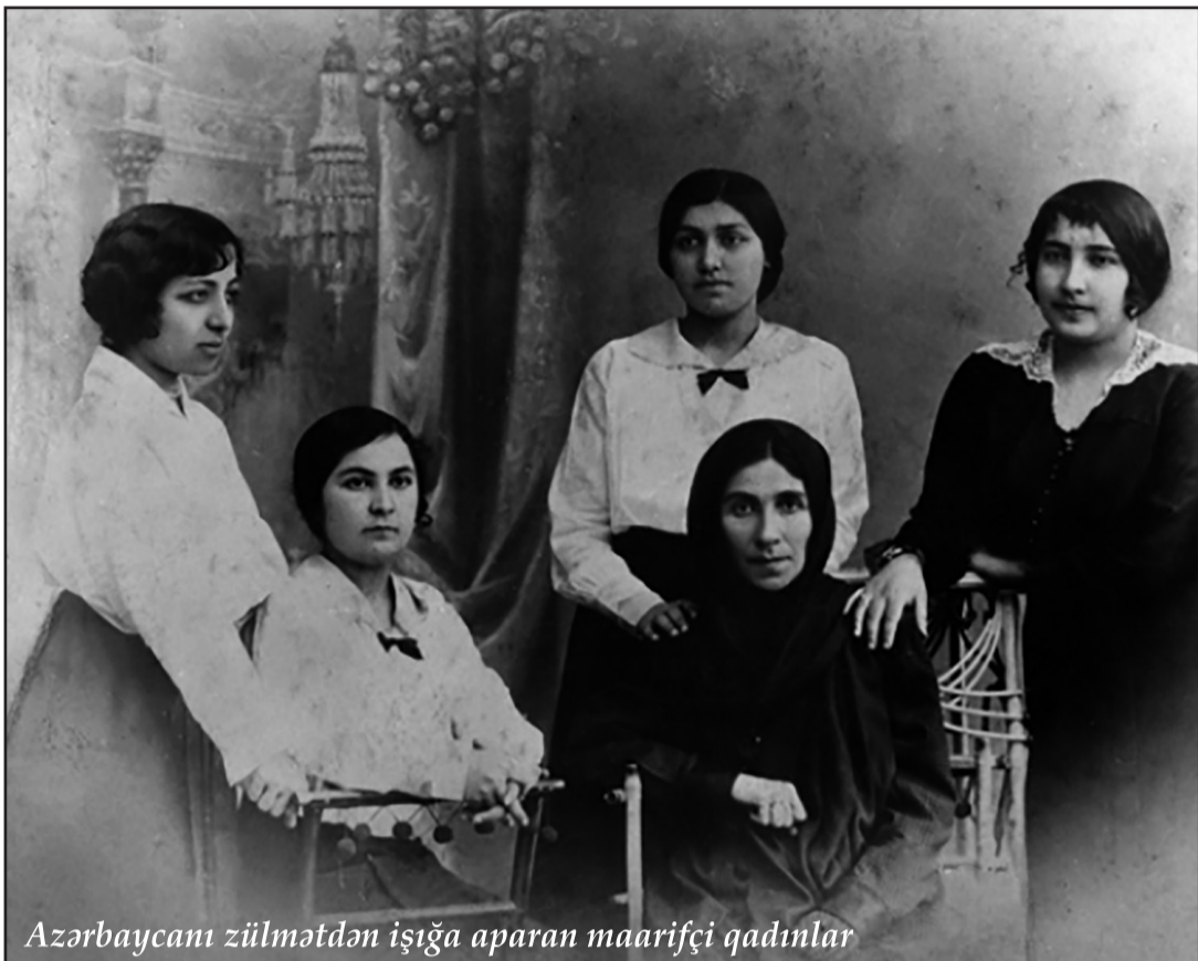
Azərbaycanı zülmətdən işığa aparan maarifçi qadınlar

Hər bir cəmiyyətdə mərhəmət, insanpərvərlik, qayğı kimi hisslər əsas yer tutmalıdır. O cəmiyyətdə ki, həm dövlət qurumları, həm də vətəndaş cəmiyyəti məhz bu prinsiplər əsasında həm öz həyatını, həm də öz fəaliyyətini qurur, o cəmiyyət inkişaf etmiş, uğurlu cəmiyyətdir.