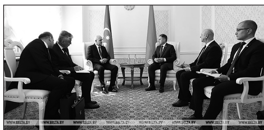
послужит активизации нашего взаимодействия в сферах экономики, про-

Он отметил, что Беларусь и Азербайджан очень активно развивают сотрудничество по всем направлениям, в этом году 30-летие дипломатических отношений. Тон двустороннему взаимодействию задают постоянные контакты лидеров двух стран, также регулярно встречаются главы правительств. Налажено и молодежное сотрудничество. «Надеюсь, сегодняшняя встреча