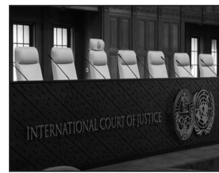
публикации замминистра иностранных дел

Азербайджан представил в Международный суд свои замечания относительно предварительных возражений Армении в деле (Азербайджан против Армении) о применении Международной конвенции о ликвидации всех форм расовой дискриминации. Об этом говорится в