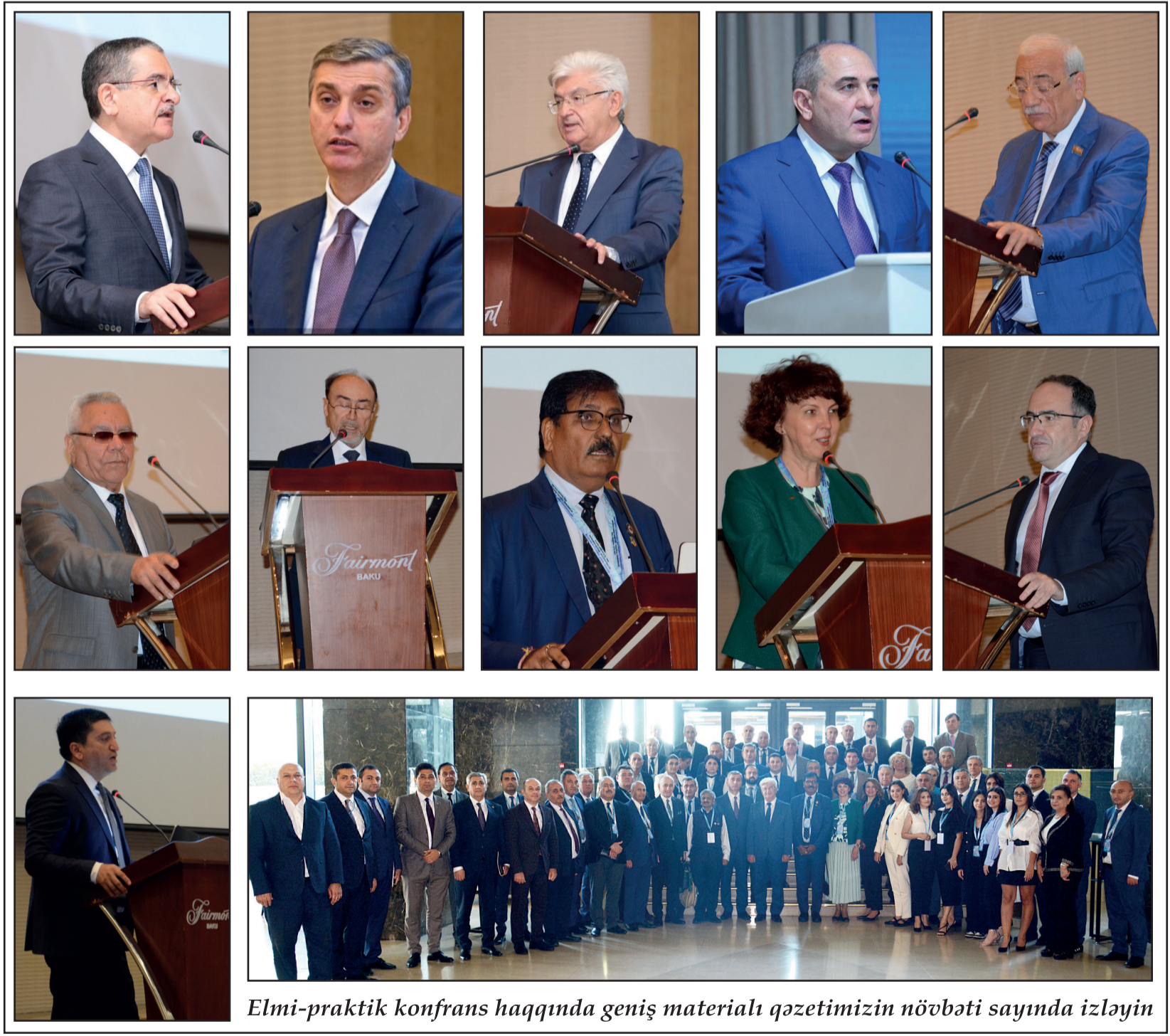
Elmi-praktik konfrans haqqında geniş materialı qəzetimizin növbəti sayında izləyin

İlham Əliyev, Azərbaycan Respublikasının Prezidenti Bakı şəhəri, 15 sentyabr 2023-cü il