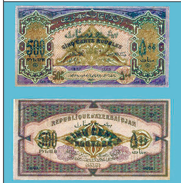
Azərbaycan Demokratik Respublikasının pul nişanları (1919-1920)

1919-cu il dekabrın 1-də Parlamentin qəbul etdiyi qanuna əsasən, hökumətə Azərbaycan Xalq Cümhuriyyətinin 600 milyon manat məbləğində pul nişanlarını buraxmaq barədə icazə verildi. Bakı