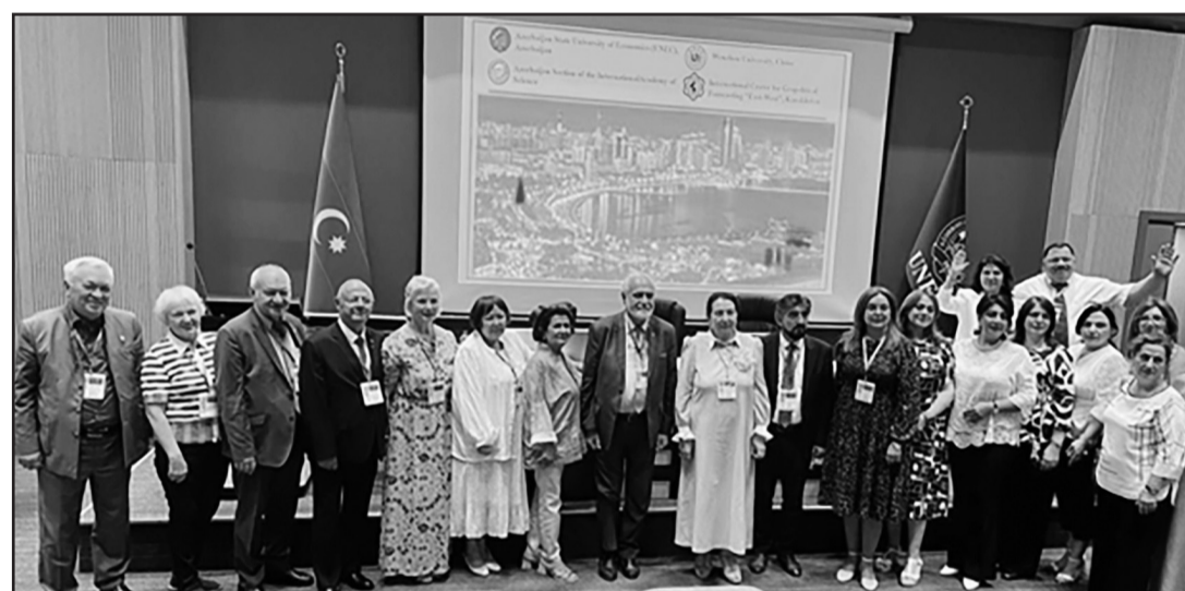
Участники Международного Симпозиума и 1-й Сессии Азиатской Академии Наук

стран Азии в мировой экономике составляет более 35%. Одним из основных показателей научно-технического развития стран является подача заявок на получение патентов на изобретения. Так вот, ежегодное число подаваемых заявок на получение патентов на изобретения во Всемирную Организацию Интеллектуальной Собственности в странах Азии составляет более 70% от общемирового числа подаваемых заявок. Цель ААН - это консолидация ученых Азии в создании Единого Академического и Интеллектуального Пространства Азии (ЕАИПА) и решении актуальных проблем современной цивилизации. Кроме того, было доведено до участников 1-й Сессии ААН, что название «Азиатская Академия Наук» получило официальную международную регистрацию.