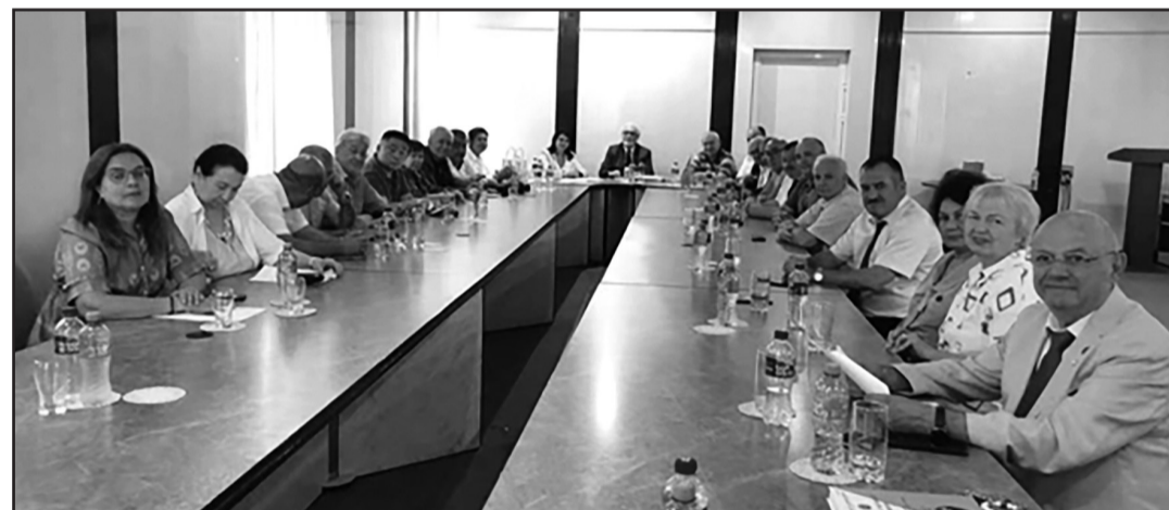
Заседание первой сессии Азиатской Академии Наук

известные ученые с мировыми именами. Несмотря на то, что на сегодня создано немало различных академий во всем мире, Азиатская Академия Наук (ААН) принципиально отличается от всех существующих академий, прежде всего своей целью и поставленными задачами. Хочу особо подчеркнуть, что Азия на сегодня является признанным лидером в стремительном и эффективном развитии высоких технологий, включая робототехнику и искусственный интеллект. Азия охватывает 50 стран, в том числе таких научных и индустриальных лидеров, как Китай, Россия, Япония, Южная Корея, Индия, Малайзия и т.д. В Азии проживает более 60% населения нашей планеты. Доля