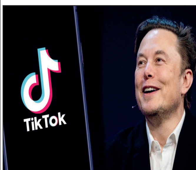
ABŞ hökumətinin Səməraliliyi Departamentinin (DOGE) rəhbəri olan milyarder İlon Mask

"TikTok" sosial şəbəkəsini almaqda maraqlı olması ilə bağlı şayiələri təkzib edib.